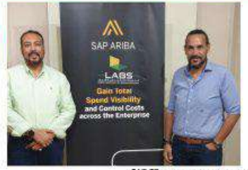
البرمجيات كخدمة بواسطة SAP SE أضافت قيمة الشركة من خلال تراكم خبراتها في إضافة مجموعة من الوظائف الأكبر . من خلال مهندسين وقسم الأبحاث والبرمجيات بما ، وذلك من خلال تقنيات تحليل البيانات للحجرات ملامتا حيث تمكنتا هذه الوظائف الخاصة بنا في تسريع عملية الرقمنة لمؤسسات الأعمال وبالتالي سرعة الأستفادة من مخرجات أعمالها وتحسين خدماتها لعملائها .