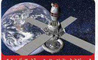
موسون: توفير إنترنت عالي السرعة في كل أنحاء العالم

تسبب وكذا وأنت في حالة من عدم اليقين - فقد تسبب ذلك في القلق. في شخص معرض لقلق الأشخاص، في حين التقليل بشكل عام، وقد يكون لقلق اكتئاب غير البريد الإلكتروني، خاصة إذا كنت قلقا بشأن نظرة الناس إليك، فإن ما كتبه يمكن أن يجعلك قلقا لأنه ليست مكتوبا في كيفية شعورك له، ما كتبه. وفق الخبراء أن اكتئاب البريد الإلكتروني غالبا ما يأتي في شكل من أشكال غير المنظمة، خاصة إذا كان لدى الشخص أنواع مختلفة من المشروبات في المنزل وقد تكون هناك توقعات حول كيف ومتى من المتفرجين أن تدر على رسائل البريد الإلكتروني، وقد يشعر شخص ما بالقلق من أن الآخرين لنهم توقعات حول كيف ومتى يجب أن يستجيبوا. إذا كنت قلقا وتغير نفسك في إصدار قوائم المهام المتعلقين من الأشياء عند الانتهاء من سرعة وعدم الاتصال عبر البريد الإلكتروني يمكنك خلق ضغط أيضا. وإذا كنت تعتقد بطيئة العمل في البريد الإلكتروني، في رسائل البريد الإلكتروني، الوقت المناسب وبطريقة مرسوة هو شكل من أشكال التهرب، فمن المحتمل أن تشعر بتعب من العمل على الهاتف أو شحنته على ذلك.